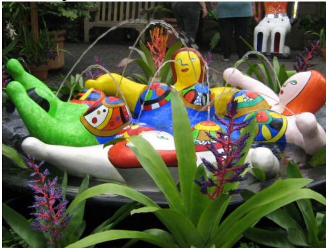
Les nanas prennent leur bain ...