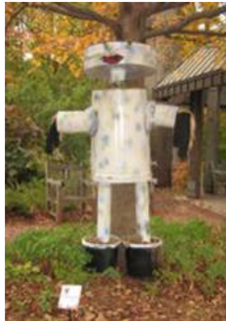
Il y avait plein de décorations d'Halloween